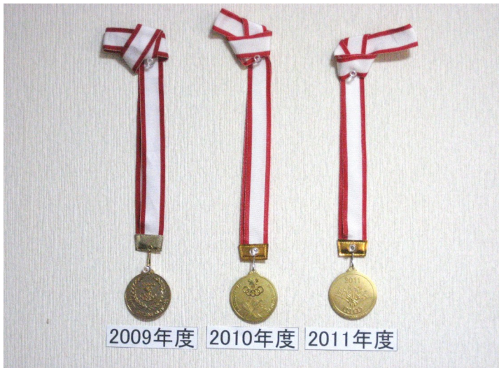
2009年度 2010年度 2011年度

堺市民の健康、体力の向上とスポーツマンシップの高揚を図り、スポーツの普及振興を通じて市民意識の向上に資することを趣旨として、第37回の堺市民オリンピックが行われ、堺市と美原町の合併後平成20年(第34回)堺市民オリ